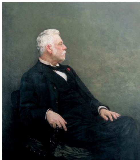
Eduard Charlemont, Heinrich Liebieg, kolem 1900, olej, plátno, Oblastní galerie v Liberci, inv. č. O 739

Wilhelm Weiss se o realizaci sochy Heinricha Liebiega zajímal už výrazně dříve než před polovinou dvacátých let 20. století. Ještě před zadáním návrhu velkolepého pomníku zamýšlelo město uctít památku Heinricha Liebiega na základě přijatého městského usnesení ze dne 9. dubna 1904 vyhotovením mramorové sochy 13 a pamětní desky zesnulého, které by byly vystaveny na radnici. 14 K plánované ideové soutěži nedošlo, neboť magistrát oslovil vybrané umělce a postupně dorazilo několik nabídek od sochařů z celé střední Evropy, mezi nimiž byl také Wilhelm Weiss. Jeho nabídkou se město nezabývalo, intenzivně ale jednalo s Theodorem Charlemontem, bratrem Eduarda Charlemona, autorem pravděpodobně neznámější podobizny Heinricha Liebiega, dnes uložené ve sbírkách Oblastní galerie v Liberci. Tento obraz si Theodor Charle-